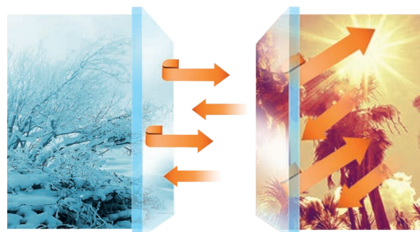
Warm in de winter